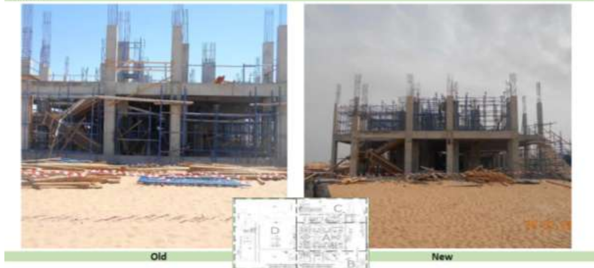
Εικόνα κατά την κατασκευή της κύριας εστίας B004A στο οικόπεδο 009