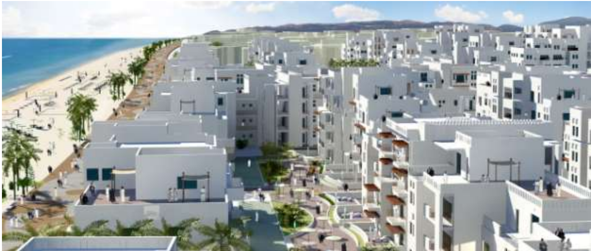
Συγκρότημα παραθαλάσσιων πολυκατοικιών (τμήματα 1.1.2 - 1.4.2)

Κ/Ξ OMAN 2009 - ΚΑΝΩΝ ΜΕΛΕΤΗΤΙΚΗ Ε.Ε. (2009 - )