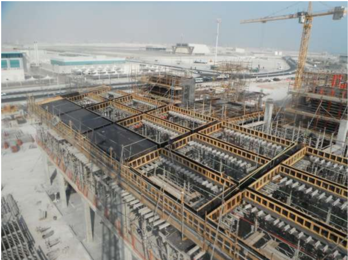
Εικόνα κατά τη διάρκεια της εγκατάστασης του ξυλότυπου της στέγης