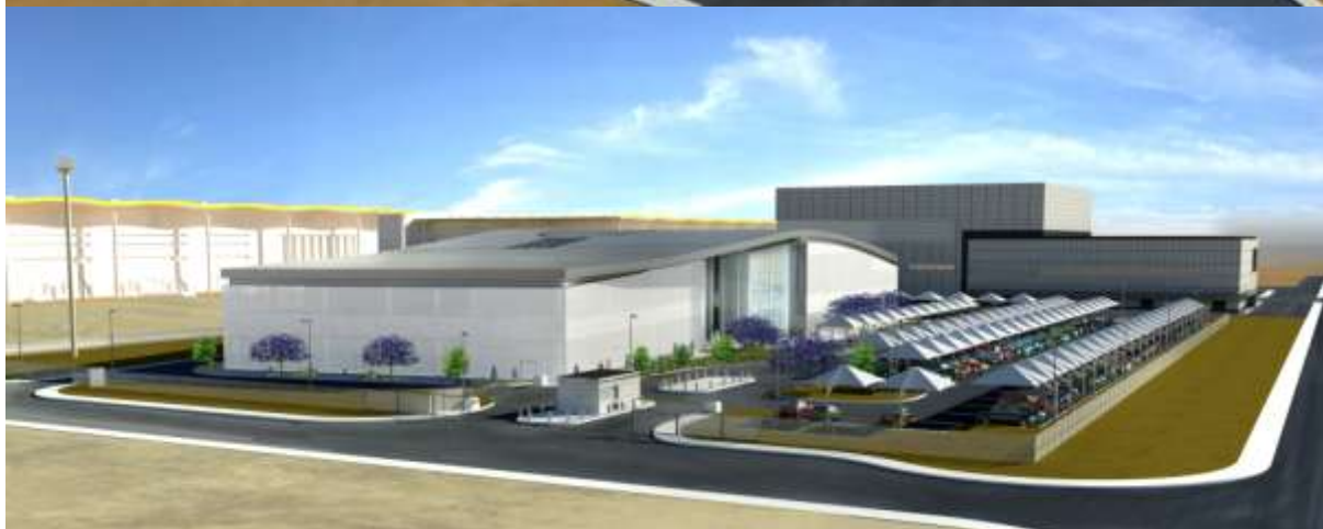
Αρχιτεκτονικές απεικονίσεις του κτηρίου και του περιβάλλοντα χώρου