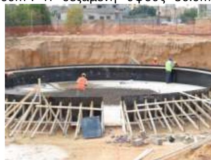
Στατικό προσομοίωμα υδατόπυργου χωρητικότητας 500\text{m}^3 νερού

Δεδομένης της πολιτικής κατάστασης και των αναταραχών στη χώρα, όλες οι εργασίες έχουν αναβληθεί.